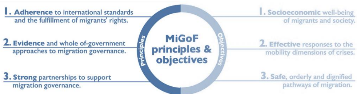
Figura 1. Principios y objetivos del Marco de Gobernanza de la Migración

El marco conceptual para el indicador 10.7.2 es el Marco de Gobernanza Migratoria ( MiGoF ) de la OIM , que fue bien recibido por 157 países (Resolución C/106/RES/1310 del Consejo de la OIM). El MiGoF tiene tres principios y tres objetivos (figura 1).